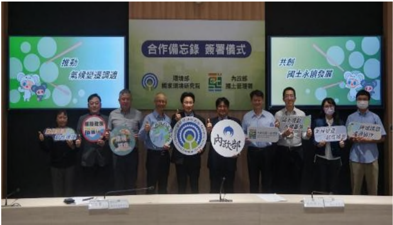
圖 6、國家環境研究院與內政部國土管理署簽署合作備忘錄