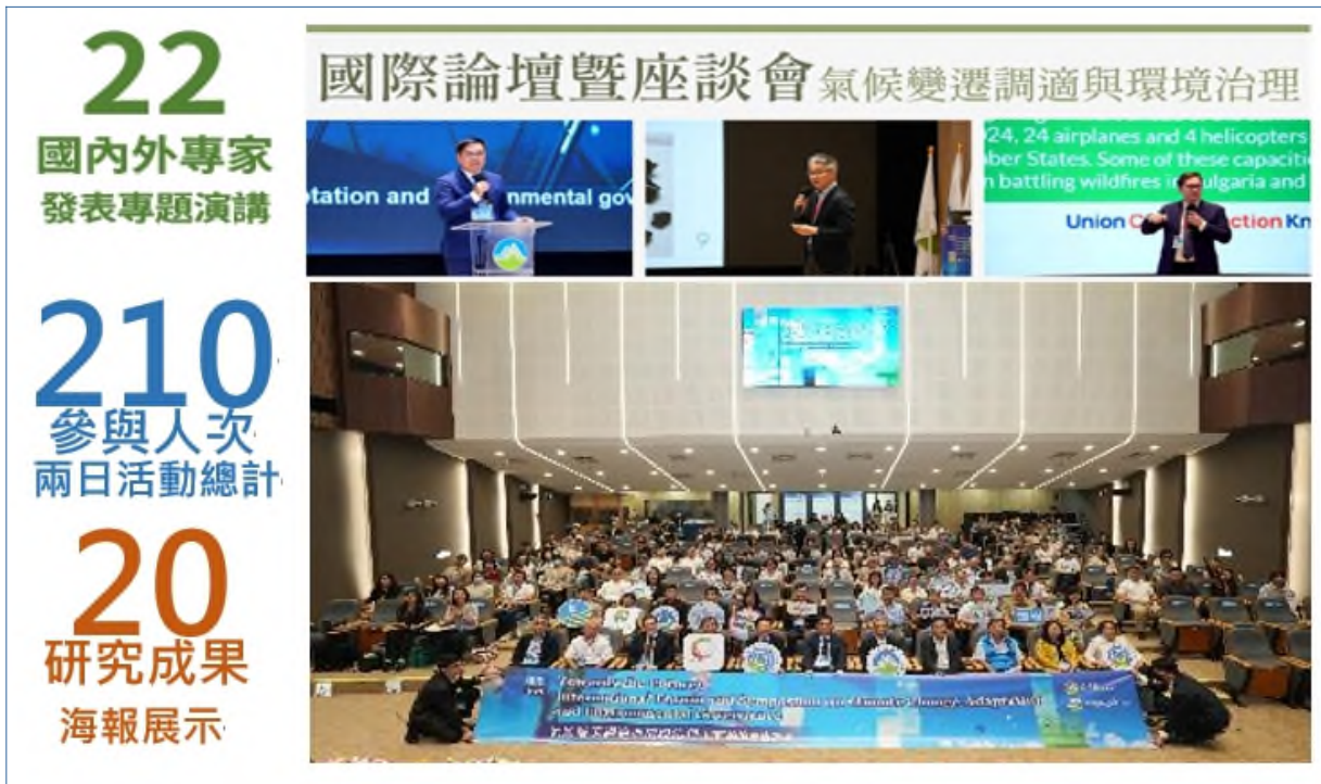
圖 4、國際論壇暨座談會執行成果

候變遷、淨零排放等議題進行深入研究，並開發創新技術，為政策制定及執行提供實證支持（如圖 6）。