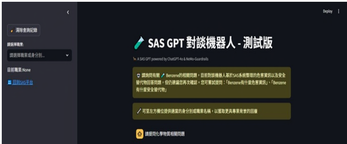
圖 1、模組系統介面一對談機器人測試版