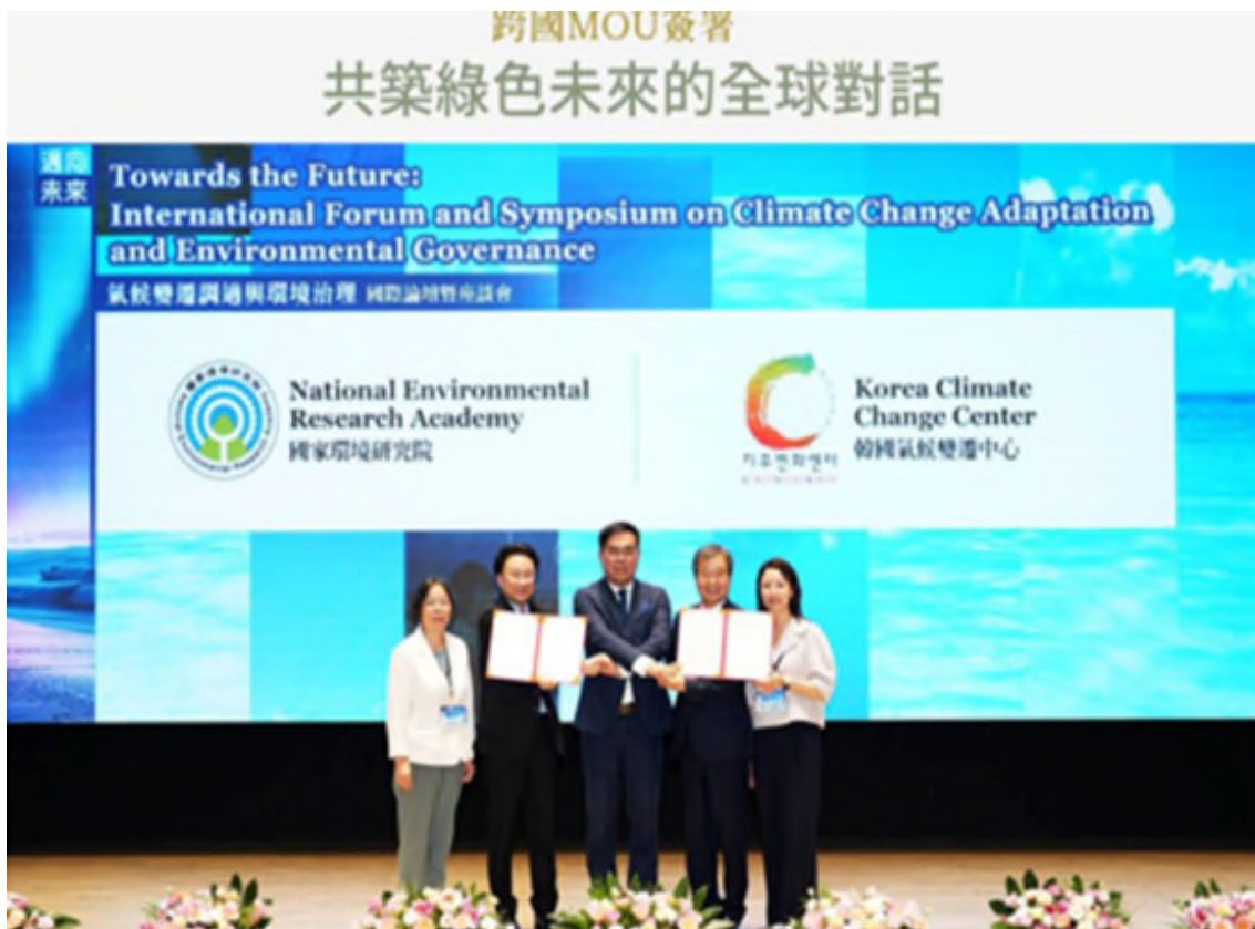
圖 5、國家環境研究院與韓國氣候變遷中心簽署合作備忘錄