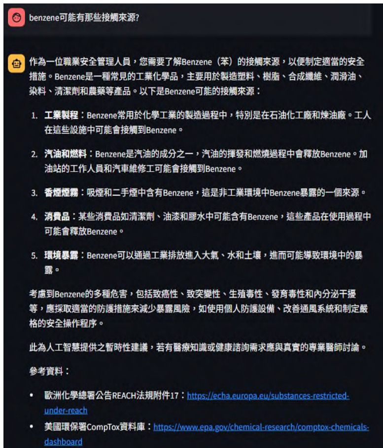
圖 3、模組系統介面一對談機器人測試版（職安管理人員版）