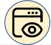
民眾下載及瀏覽次數統計