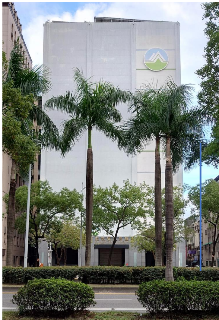
環境部的前世今生