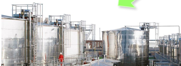
廚餘提煉生質燃油