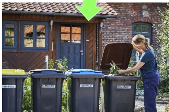
有機廢棄物製造堆肥