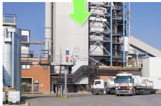
收集生質廢料沼氣發電