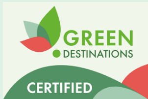
綠色旅遊目的地標章