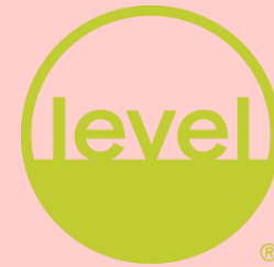
家具產品永續驗證 (BIFMA LEVEL)