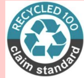
回收聲明標準RCS (僅認RCS 100)