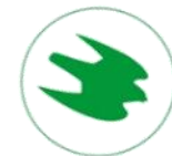
瑞典優良環境選擇標章